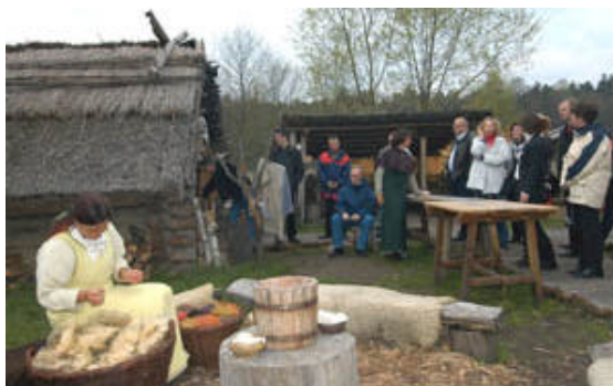
Tradycyjne rekodzielnictwo w „Ukranenland”