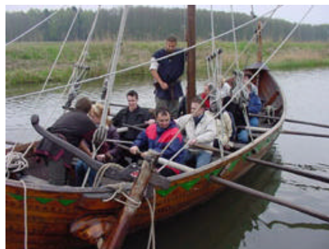
Wszystkie ręce na wiosła! Podróż historyczna łodzią „Svarog”

Drugie międzynarodowe spotkanie odbędzie się w październiku w powiecie Saarpfalz.