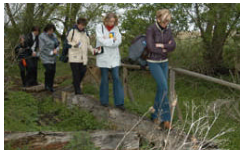
Na szlaku natury (Zerum)

Rozmawiano także o aspektach historycznych turystyki, której przykłady zostały zaprezentowane w skansenie „Historische Werkstätten Ukranenland e.V.” w mieście Torgelow. Spotkał się z dużym zainteresowaniem wszystkich uczestników projektu. Przedstawiciele Powiatu Saarpfalz prowadzi współpracę w podobnym projekcie na granicy niemiecko – francuskiej, który traktuje o historii Celtów i Rzymian. Jest to również atrakcja turystyczna ich regionu.